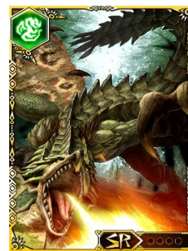
CM 放映記念ログインキャンペーンでもらえる 限定 S レアカード『陸戦女王リオレイア』

また、テレビ CM は第二、三弾とシリーズ化される予定で、ゲーム内では期間中にログインすると、「クエPチャージ」、「レアガチャ券」、「強化像セット」、「アビ玉セット」、「S レアガチャ券」等、豪華なゲーム内アイテムをプレゼントするキャンペーンを引き続き実施いたします。