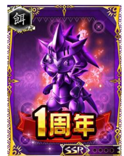
アニバーサリー全アビ玉