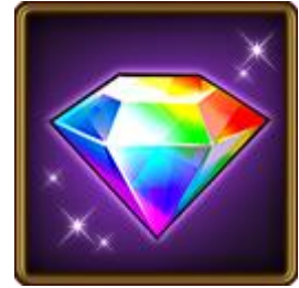
ログインでもらえる「魔宝石」

新 CM の放映を記念して、期間中に『黒騎士』にログインした方全員に、特別ログインボーナスとして合計 100 個の「魔宝石」(ログイン 1 回につき 10 個×最大 10 回まで)をプレゼントします。